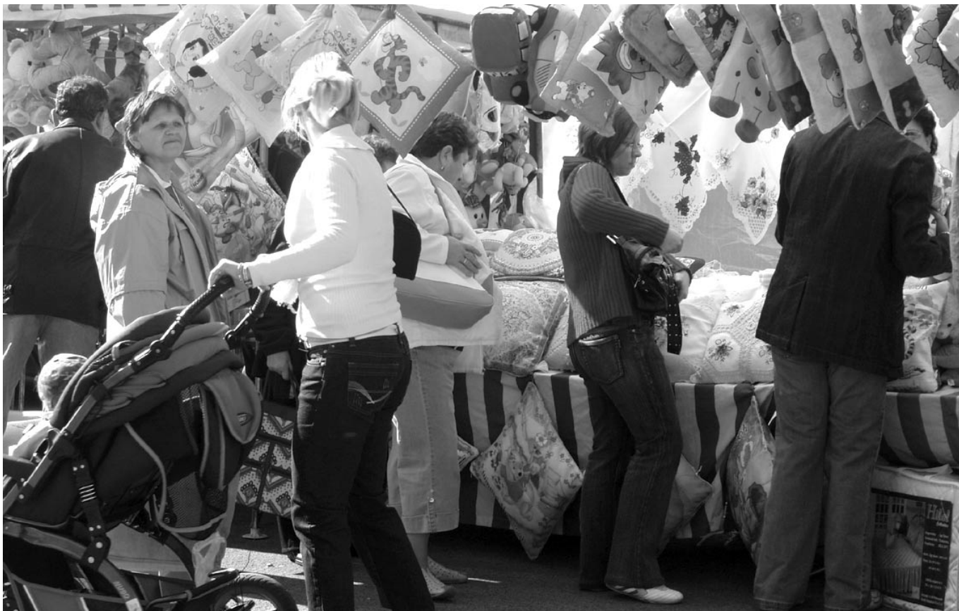
Tavaly novemberben, idén októberben rendezik a hagyományos vásárt

– Az idei vásáron nem lesznek kulturális kísérő programok, de ha az időjárás kegyes lesz hozzánk, akkor a szokásos utcából nem marad el. Érdekessé és rendkívülivé egy különleges esemény teszi az idei vásárt. Ugyanis szombaton délelőtt körül-belül 11 órától, községünkön keresztül haladnak át a Bécs – Pozsony – Budapest szupermaraton résztvevői. A templomnál lesz kialakítva a csapatok számára a váltóhely, frissítőt pedig a tűzoltószertár előtt vehetnek magukhoz a résztvevők. Az áthaladás ideje alatt kultúrtúrműsorral kedveskedünk a résztvevőknek. (–)