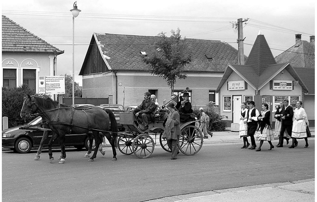
A felnőtt és gyerek bósi néptáncsoport lovaskocsin járták a falut