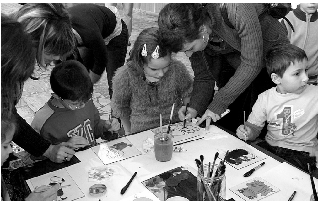
Fontos, hogy gyermekeink anyanyelvű oktatásban részesüljenek

A fent említett természetellenes jelenségek közé tartozik az is, ha egy magyar szülő szlovák iskolába írta be gyermekét. Mert a szlovák nyelvű iskolákat azért nyitották meg édes szülőföldünkön, hogy oda – értelemszerűen – szlovák anyanyelvű gyerekek járjanak, és ott, – a folytonosság elvét követve – folytassák a tudás elsajátítását azon a nyelven, amit apáiktól és azok felmenőitől örökölték. Mert ez a szlovák nemzet számára normális. Egy született szlovák gyereket ne erőltessen senki a magyar iskolába, mert értelmében és lelki fejlődésében zavar keletkezik. Így van ezzel minden kisgyerek, akit a világon bárhol, az anyanyelvétől eltérő, más nyelvű iskolába kényszerítenek. Igen, kényszerítenek, hiszen ki