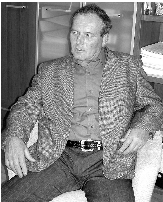
Amellett, hogy önkormányzati képviselő, egy vegyesbolt tulajdonosa is

– Szeretem a szülőhelyemet, ezért vállaltam a megmérettetést, majd a képviselői munkát, mert ebben a tisztségben még többet tehetünk Bősért – hangsúlyozzák mindketten. Aztán arról beszélnek, hogy egyes vélekedésekkel ellentétben nem fenéig tejfel a képviselőség. Sokkal inkább pluszmunka, olykor gond is. – De nem panaszkodunk, hiszen mi vállaltuk, s az a legnagyobb öröm, amikor látszik a közös munka eredménye. Konkrét példaként a korszerű, s az egész településre kiterjedő közvilágítást, a tetszetős, az ide látogató turisták által is dicséret autóbuszmegállókat, az uniós pénzekből és a szükséges önrészből felújított Amadé László Ma-