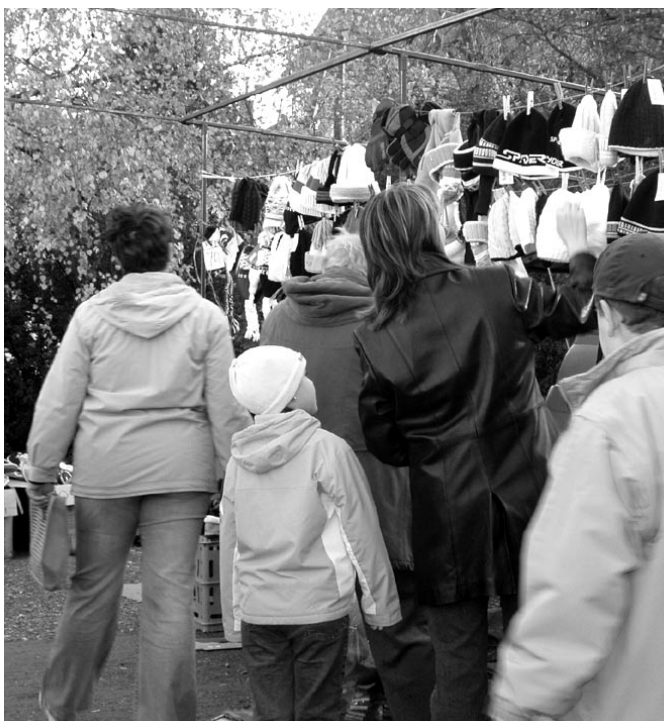
Nagy az érdeklődés, nemcsak a bősiek körében