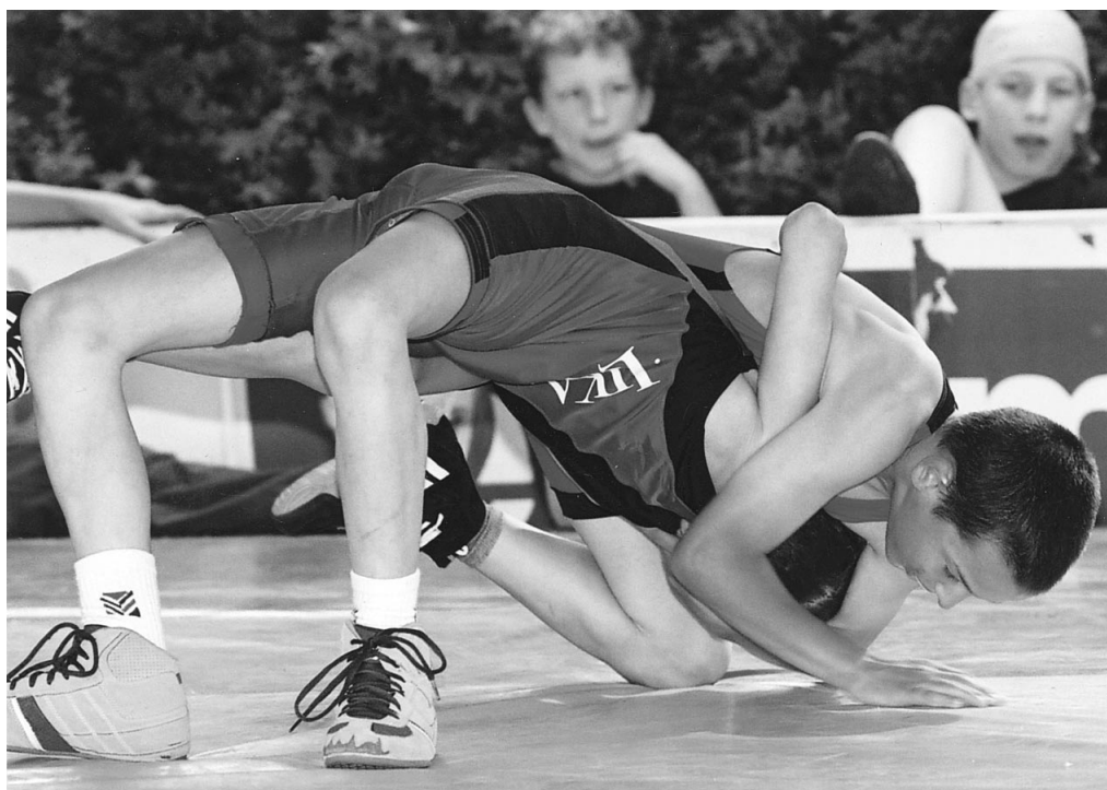
A bősiek kitétek magukért Nový Jičínben

A Bósi Birkózóklub versenyzői ismét kitétek magukért. Nemrégiben Nový Jičínben vendégszereltek, ahol immár visszajáró vendégnek számítanak. A sorrendben hetedik Miroslav Rešl Emlékversenyen negyedszer léptek szőnyegre a csallóköziek, akik elsősorban az utánpótlás korosztályban taroltak.