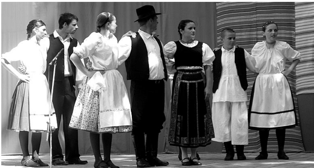
Nagy sikert arattak a helyi táncosok