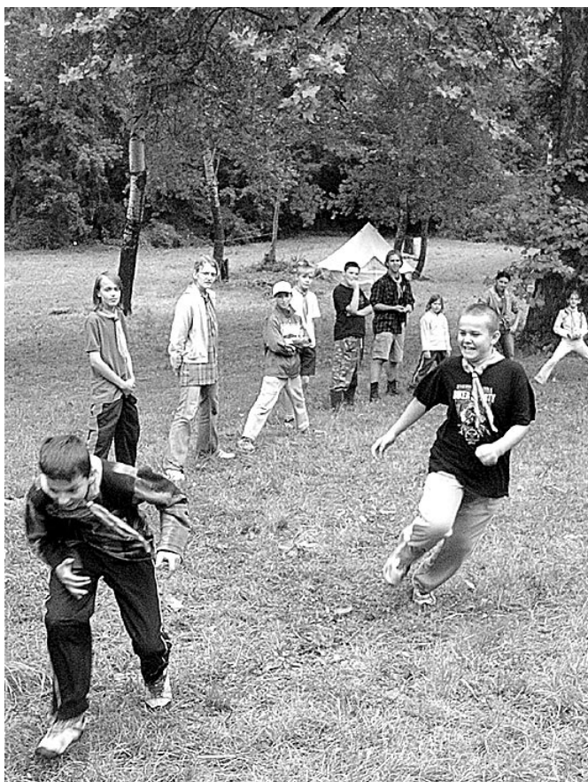
Felhőtlen játék a szabadban

Ehhez persze tudni kell azt is, hogy az ilyen táborozás nem nevezhető könnyű kis nyári pihenőnek, sem tóparti üdülésnek, hiszen ezt az együttlétet főként a rend, a fegyelem és a játékos formában történő tanulás jellemzi. A vezetők (közép és egyetemista fiatalok!) minden energiájukat bevetik a kívánt cél eléréséhez. Nem számít nekik az sem, ha ezért éppen kora hajnalban kell kelniük vagy épp kora hajnalban nyugovóra térniük. Egy ilyen táborban nincs luxus, nincs melegvíz, de jéghideg az bezzeg van! Hogy milyen volt a program? Túra a lioni holtág körül, méta- és focibajnokság, zsonglór- és íjásztanfolyam, táncház az Aranykerttel, jelmezkészítés, népdaltanulás, „ram-