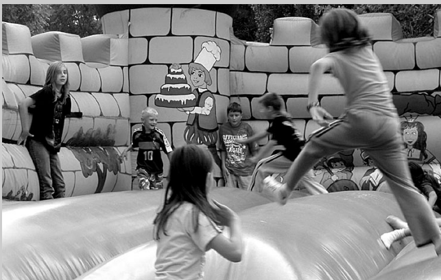
Nem csak a felnőtteknek volt jó szórakozás, hanem a gyerekeknek is