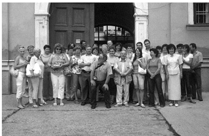
Az idősek lehetőségeikhez mérten kapcsolódnak be a nyugdíjasotthon életébe