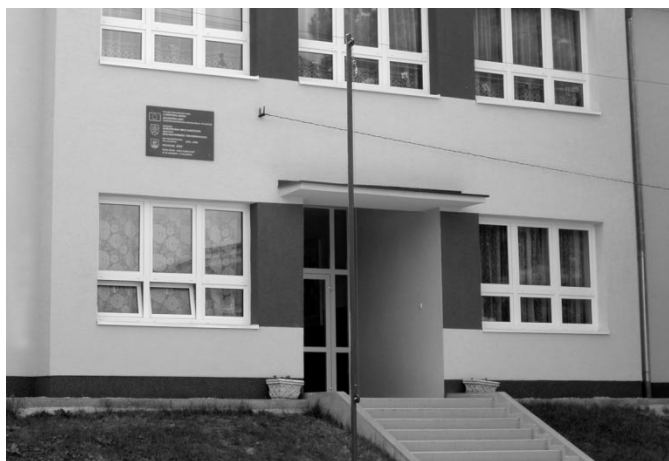
Az Amade László Magyar tannyelvű Alapiskolát idén 377 diák látogatja