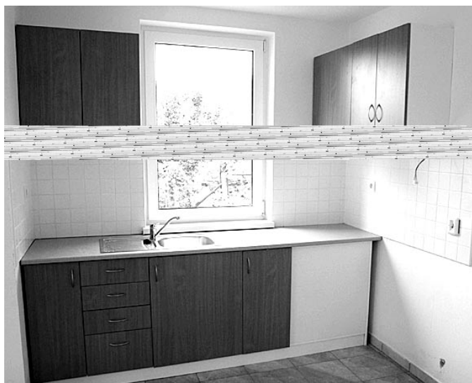
Jövőre már finom illatok áradnak ebből a konyhából is